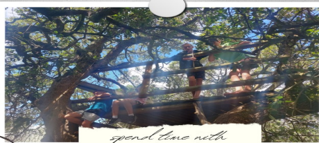
spend time with friends